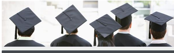
Formaciones Plataformas A9 - COGATE

2024 – Durante todo el año, mensualmente, y gracias al acuerdo del Colegio Oficial de Gestores Administrativos de Santa Cruz de Tenerife con la Plataforma ARA A9, se han impartido formaciones para que los Colegiados puedan emitir Certificados Digitales a sus clientes a través de dicha plataforma.